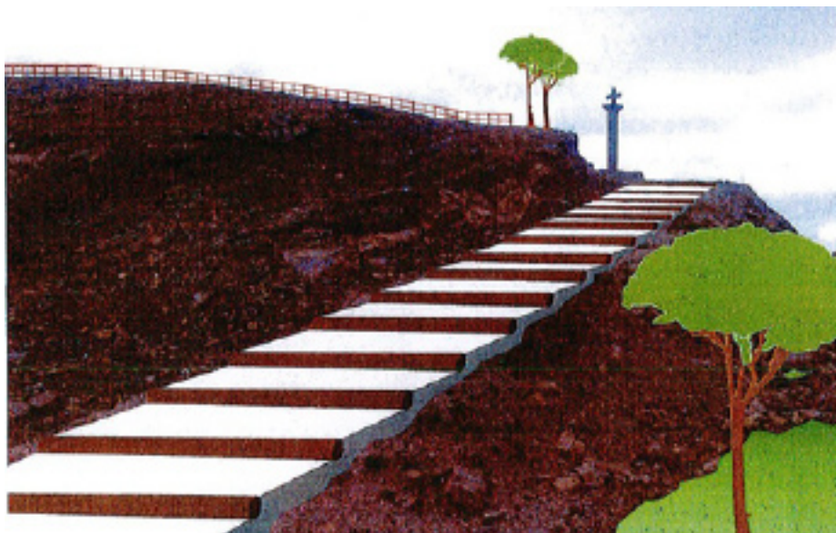
Recreación de la actuación que se hará en el mirador, según la memoria.