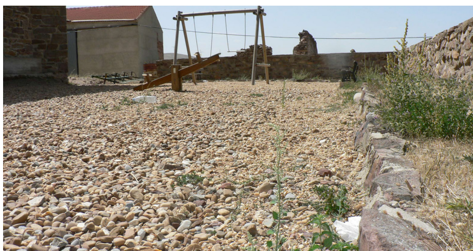
Aspecto del parque, con juegos viejos y un suelo de cantos y piedras peligrosas.

Los juegos existentes están viejos y deteriorados, y el suelo de canto y grava, con bordillos de piedras cortantes resultan muy peligrosas