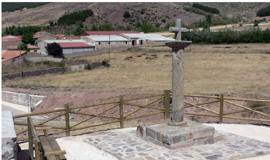
Nuevo aspecto de la Cruz de Canto.