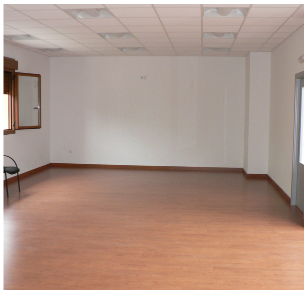
Fachada del nuevo edificio municipal que se comparte con la Sociedad Terrenos y Moncayo, y el salón de usos múltiples.