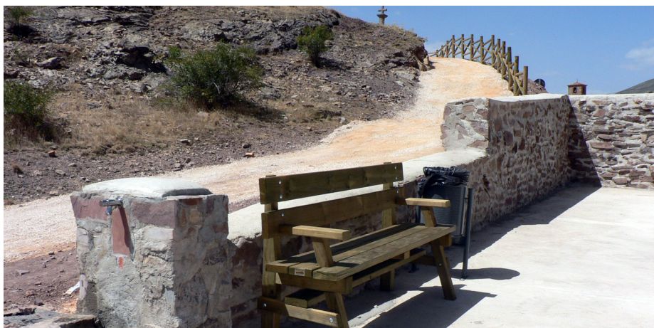
Nueva área de descanso con fuente, banco y aparcamiento.

y la creación de una pequeña área de descanso, a los pies de la cruz, con fuente, bancos, papelera y un aparcamiento. Esta es la primera actuación, entre otros proyectos que quiere sacar adelante el alcalde, Jose Luis Fuente, que busca el objetivo de embellecer y poner en valor el patrimonio de Beratón.