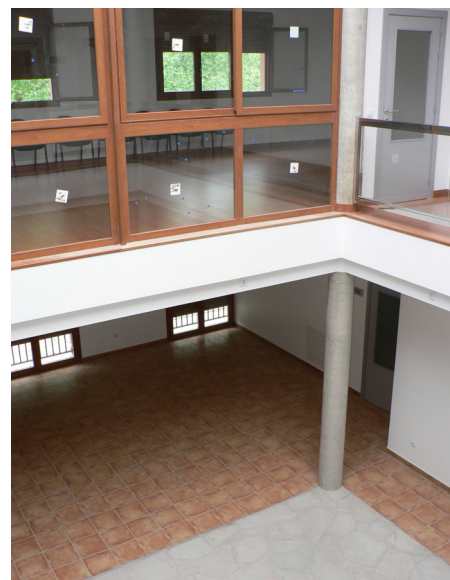
Imagen del patio interior del inmueble.

dispone de salas para Secretaría, Alcaldía y Archivo. Además, hay otras dependencias, como el Salón de Usos Múltiples, que se comparten con la Sociedad. En este sentido, el alcalde está pendiente de saber que uso va a dar la Sociedad a los locales, puesto que uno de ellos está preparado para bar.